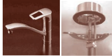
新型上面施工 アダプタ

対象:ノーマルタイプ TKHG31型 :ハンドシャワータイプ TKHG32型、TKHG38型