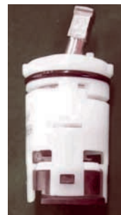
〈カートリッジ外観〉