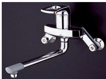
〈シングルレバー製品外観〉