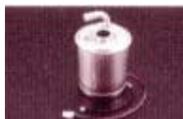
活性炭カートリッジ

【参考】 活性炭カートリッジ・・・カビ臭、カルキ臭、総トリハロメタンを除去。 加熱洗浄のためのヒータ付き。 中空糸膜カートリッジ・・・赤サビ、雑菌を除去。