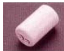
中空糸膜カートリッジ

TEK500タイプの場合 品番 : TH632-7S TEK510・511タイプの場合 品番 : TH662R 希望小売価格: ¥13,000