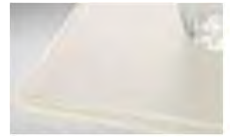
クリスタルグレージュ