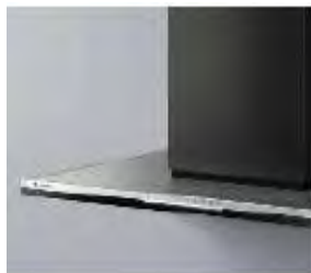
ブラック (つや消し)

デザインセンターフードVI / デザインサイドフードVI NEW 2層構造のカラーバリエーション