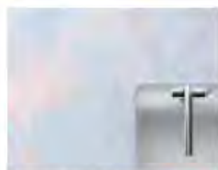
クリスタルカウンター ラールブル NEW