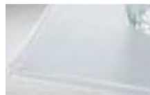
クリスタルグレー