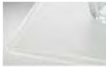
クリスタルスノー