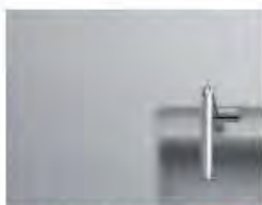
クリスタルカウンター クリスタルダルグレー NEW