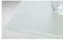
クリスタルハールグリーン