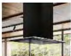
デザインサイドフードVI デザインセンターフードVI NEW