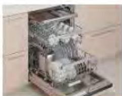
食器洗い乾燥機P (ODトオプ・ワイ-X・7%薪材) NEW