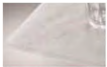
カラカッタカロー