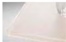
クリスタルライトピンク