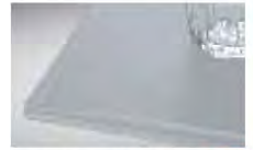
クリスタルダルグレー NEW