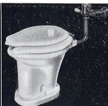
ウォッシュユダウン式 大便器 C15 355×455×380 T150L フラッシュ バルブ T52S スパッド CS152 前割蓋付便座 T53 床フランジ