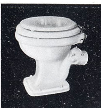
ウォッシュユダウン式 大便器 C29P,S 362×460×406 T52S スパッド CS162 前丸蓋付便座 T29P 掃除口締付ボ ルト