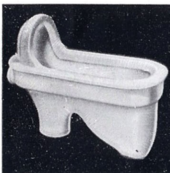
和風トラップ付大便器 C125 275×560 (参考附属金具) T150B フラッシュ バルブ T80 スパッド