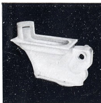
茶室向サイホンゼット 大便器 C102 275×560 (参考附属金具) T200A 足踏フラッシュ バルブ T200B スパッド(小) T80 〃 (大) T53 床フランジ