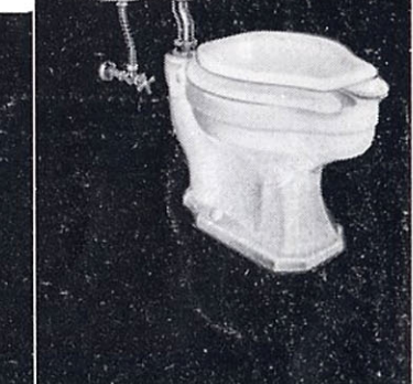
サイホンゼット式大便器 C38 355×640×370 S31 525×195×410 T50S ロータンク 内部金具一式 T51S スパッド T54Z オフセット管 CS152 前割蓋付便座 T53 床フランジ