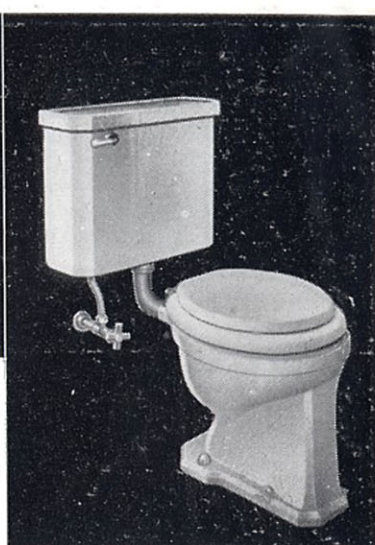
サイホン式大便器 C31 355×455×370 S31 525×195×410 T50S ロータンク 内部金具一式 T51S スパッド T54L ベンド管 CS162 前丸蓋付便座 T53 床フランジ