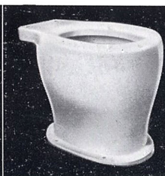
洋風非水洗式大便器 C47 330×465×360