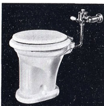
ウォッシュユダウン式 大便器 C16 355×430×380 T150L フラッシュ バルブ T52S スパッド CS162 前丸蓋付便座 T53 床フランジ