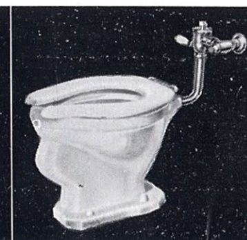
サイホン式大便器 C21S 355×495×380 T150L フラッシュ バルブ T52S スパッド CS151 前割蓋無便座 T53 床フランジ