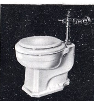
小児用サイホンゼット式 大便器 C39 330×520×330 T150S フラッシュ バルブ T52S スパッド CS168 前丸蓋付便座 T53 床フランジ