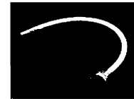
延長用フレキホース

シングル本体部、フレキホース、その他接続部材の品番につきましては、Q&Aにてご確認ください。